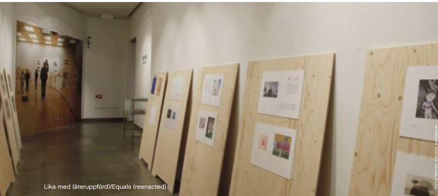
Lika med (återuppförd)/Equals (reenacted)