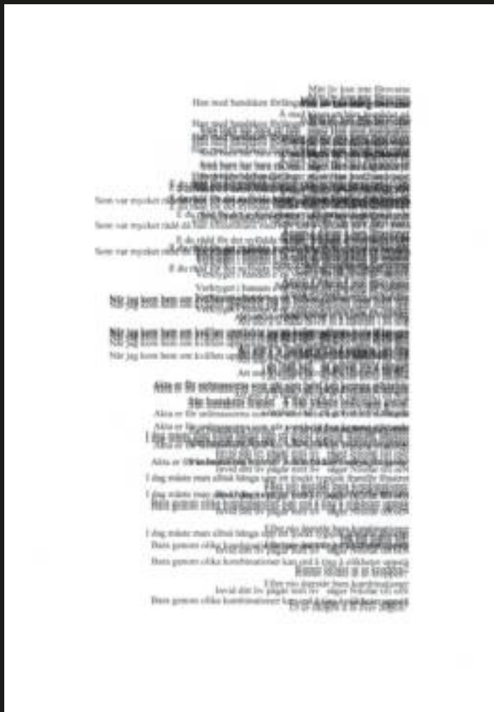
Visual Poetry and/or graphic score. From the written version "Att strö ut cyresser" (Hur låter dikten? Att bli ved II, page 20).