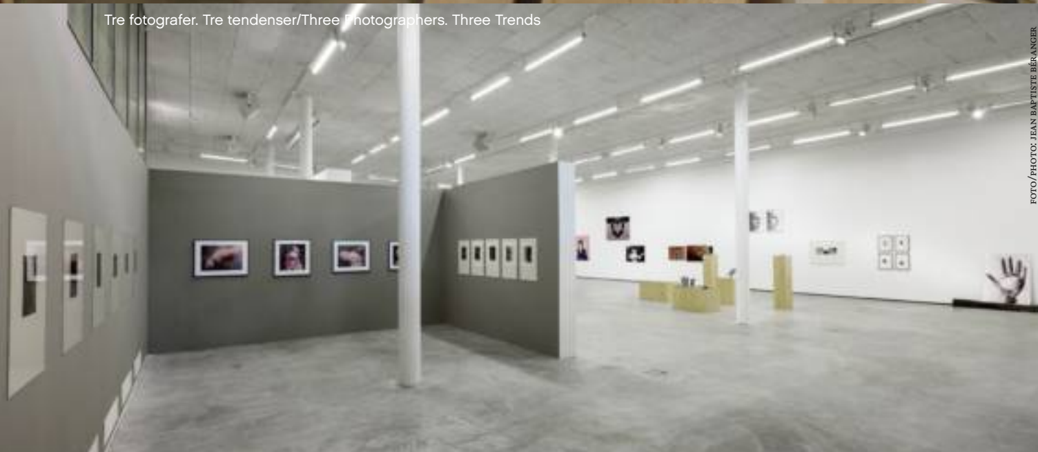
Tre fotografer. Tre tendenser/Three Photographers. Three Trends