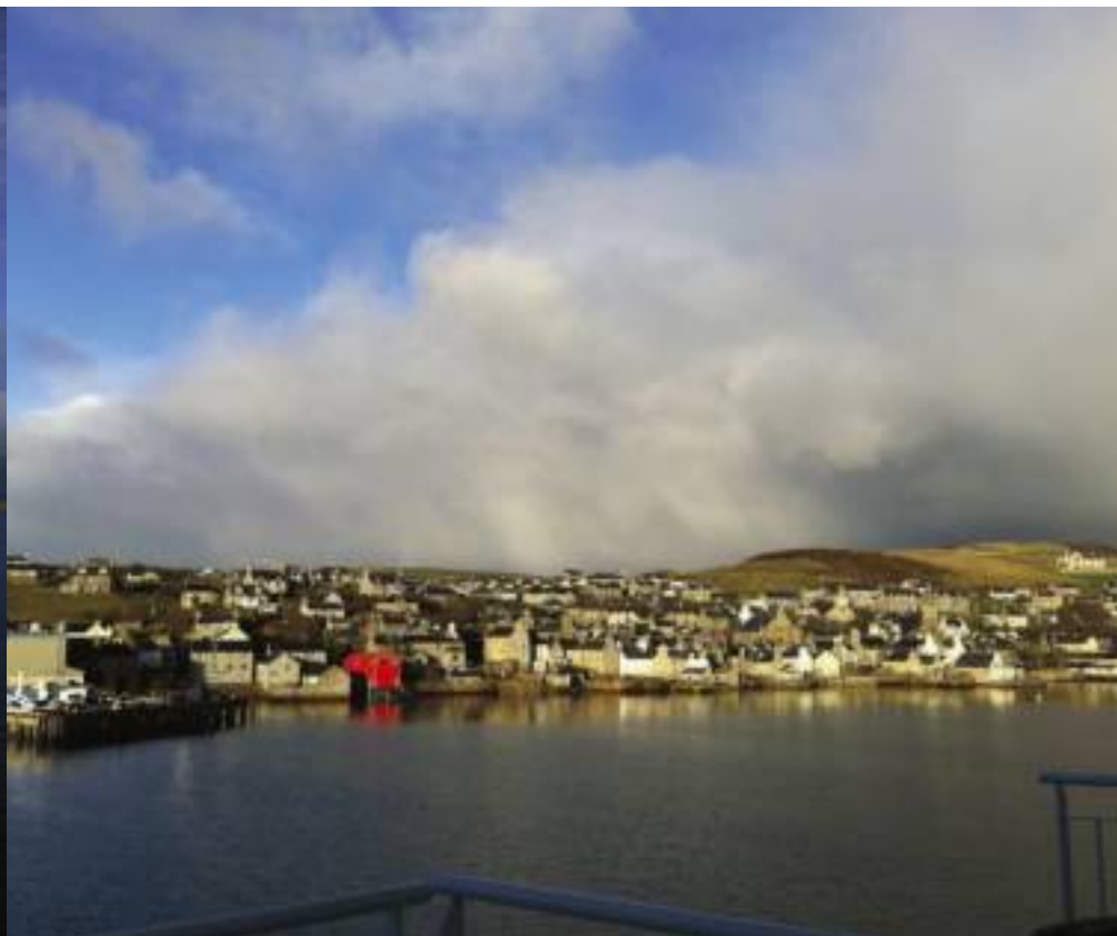
Boat trip to the Orkney Islands in December 2012.