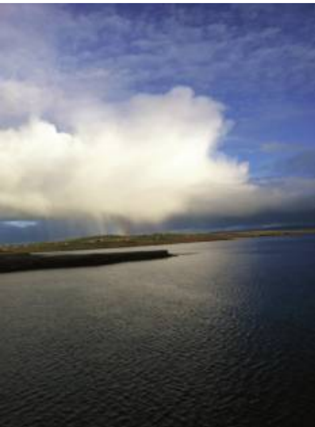
Båtfärd till Orkneyöarna i december 2012.