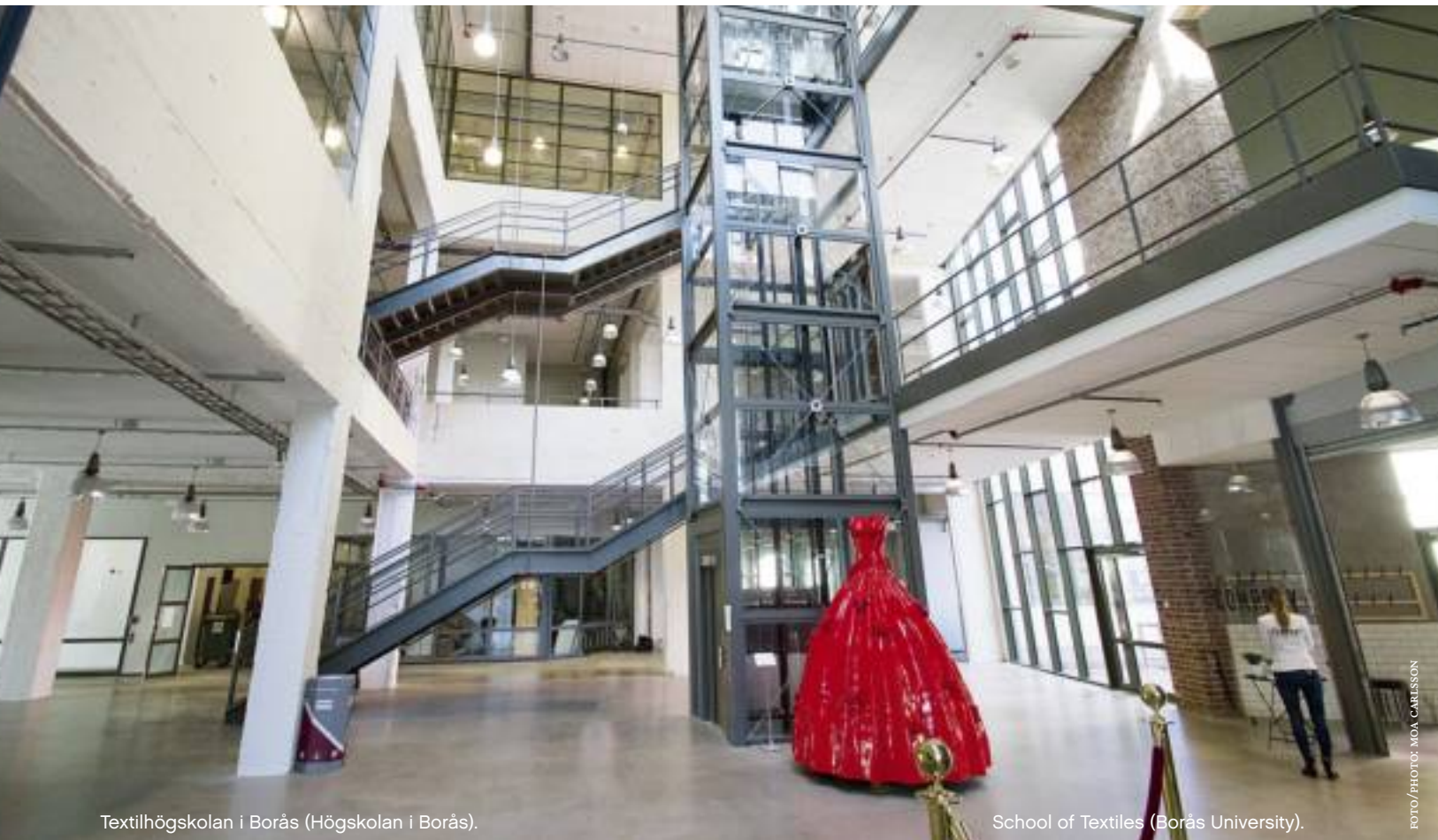
Textilhögskolan i Borås (Högskolan i Borås).