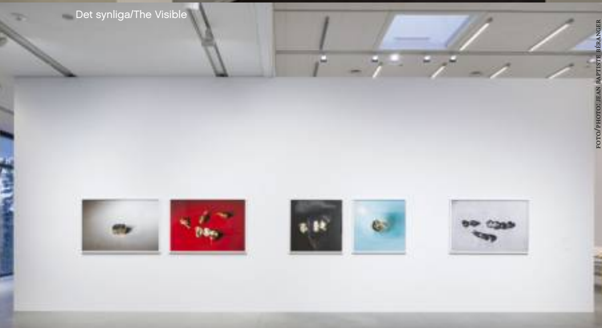
Det synliga/The Visible