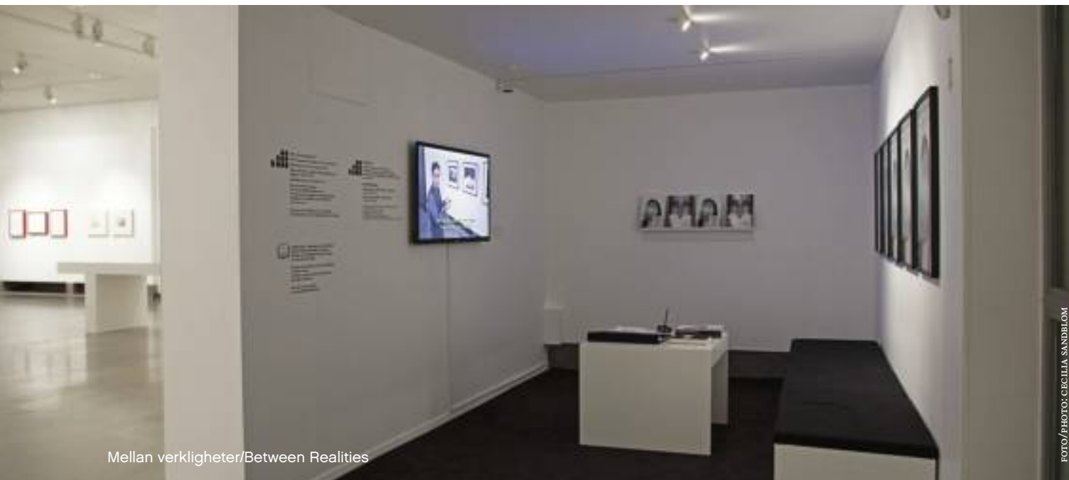
Mellan verkligheter/Between Realities